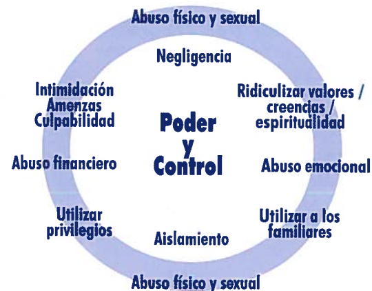
Rueda de poder y control sobre la Violencia hacia las Mujeres mayor de 60 años o más adaptada por la Coalición en Contra de la Violencia Doméstica de Wisconsin, 1999.

Las mujeres de 60 años o más, víctimas de violencia doméstica son tres (3) veces más propensas a NO sobrevivir el maltrato.